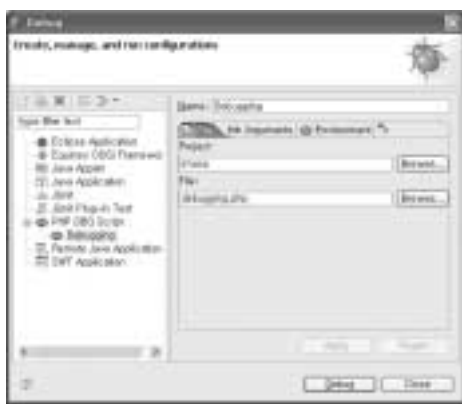
<화면 8> Debug 설정 화면

그리고 탭 메뉴의 3번째 Environment를 이동한다. <화면 9>와 같이 PHP 인터프리터를 선택하는 화면이 나타난다. 이미 지정했던 PHP 인터프리터가 선택돼 있으면, DBG는 PHP 인터프리터가 CGI 상태로 구동돼야 동작한다. 만약 PHP 인터프리터가 콘솔 구동과일인 php-win.exe(PHP 4의 경우 cli/php.exe)가 선택되어 있다면, CGI 구동방식인 php-cgi.exe로 변경한다. PHP 4의 경우엔 PHP 폴더 바로 아래에 있는 php.exe를 선택한다. Apply를 클릭하여 저장하고 Debug를 실행해 보자. <화면 10>은 Debug를 실행했을 때 Debug 영역에 나타난 결과이다. 프로그램이 정상적으로 종료되었음을 의미한다.