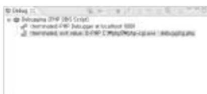
<화면 10> Debug를 실행했을 때 Debug 영역 화면