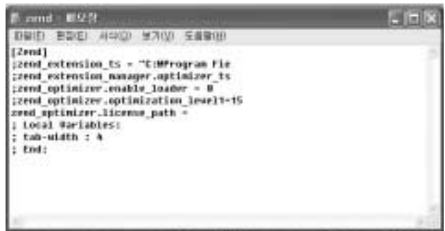
<화면 20> php.ini에서 Zend Optimizer를 비활성화 한 화면

DBG는 eAccelerator나 Zend Optimizer가 활성화 되어 있는 경우 사용할 수 없다. XAMPP의 PHP는 기본적으로 Zend Optimizer가 활성화되어 있으므로, php.ini에서 [Zend] 항목을 찾아 모두 주석처리 한다. <화면 20>은 php.ini에서 Zend Optimizer를 비활성화 한 화면이다. php.ini를 저장하고 다시 아파치 웹 서버를 시작한다. phpinfo()를 실행해 DBG가 정상적으로 설치되었는지 확인한다(<화면 21> 참조).