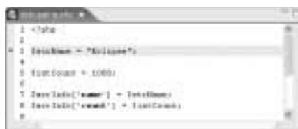
<화면 11> <리스트 4>의 소스 코드 에 Breakpoint를 지정한 화면

프로그램을 디버깅하기 위해서는 소스 코드의 어디서부터 디버깅할 것인지 Breakpoint를 지정해야 한다. Breakpoint는 프로그램이 실행되는 과정에서 디버깅을 위해 실행을 일시 중지하는 위치를 말한다. 디버깅이 되지 않을 경우는 Breakpoint를 지정하지 않아서다. 프로그램이 멈추지 않고 끝까지 실행됐기 때문이다. Breakpoint를 지정하려면 소스 코드를 편집할 수 있는 Edit 영역의 왼쪽 모퉁이를 마우스 왼쪽 버튼으로 두 번 클릭하거나 마우스 오른쪽 버튼을 클릭하여 'Toggle PHP Breakpoint'를 선택하면 된다. Breakpoint가 지정되면 동그란 점이 표시된다. <화면 11>은 Breakpoint를 지정한 화면이다. Breakpoint는 하나 이상 지정할 수 있으며 지정된 Breakpoint는 지정 방법과 동일하게 해제할 수 있다.