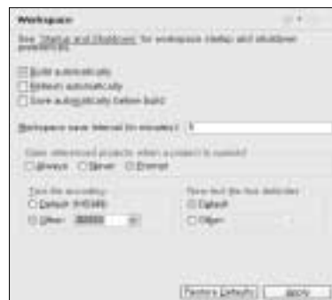
〈화면 1〉 인코딩 설정 화면

이클립스를 실행하는 운영체제가 한글 윈도우라면 이클립스의 기본 인코딩은 MS949이다. 자바의 경우 UTF-8을 많이 사용하지만 PHP는 여전히 EUC-KR을 주로 사용하므로 한글 윈도우 환경이면 EUC-KR로 작성된 소스 코드를 편집하는데 문제가 없다. 그런데 영문 윈도우는 이클립스의 기본 인코딩이 Cp1252다. Cp1252는 Western Alphabet 인코딩이라 한글이 제대로 표현되지 않는 문제가 있다. 한글 인코딩이 가능하게 하는데 두 가지 방법이 있다. 윈도우 제어판 'Regional Options(국가 및 언어 옵션)'에서 Locale을 Korea로 변경하거나 이클립스 메뉴 'Window->Preferences'에서 'General->Workspace'의 Text file encoding을 Other로 변경하고 'MS949'를 직접 입력하는 방법이다. 이전 버전의 이클립스는 인코딩 설정 항목이 'General->Editors'에 있다.