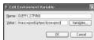
<화면 4> QUERY_STRING 환경 변수에 값을 지정하는 화면