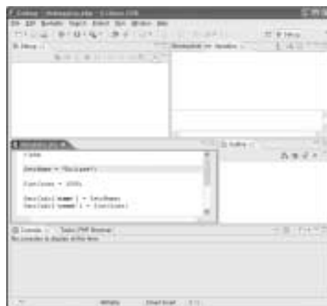
〈화면 7〉 Debug Perspective로 전환한 화면

Debugging.php 파일을 생성하였다면 메뉴 'Window -> Open Perspective'에서 Debug를 선택하여 디버깅을 위해 Debug Perspective로 전환한다. Debug Perspective는 PHP Perspective와 다르게 구성되어 있다. 〈화면 7〉은 Debug Perspective로 전환한 화면이고 [항목 2]는 Debug Perspective에 대한 설명이다.