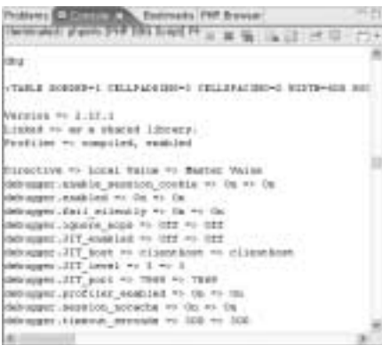
〈화면 6〉 phpinfo() 결과에 DBG 정보가 출력된 화면