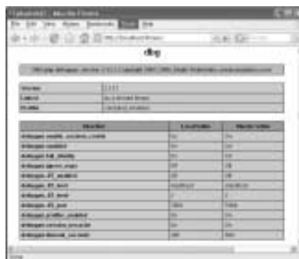
<화면 21> DBG가 설치된 화면