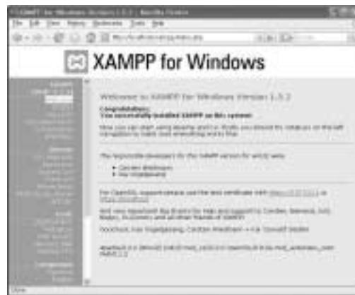
〈화면 17〉 XAMPP이 설치된 화면

XAMPP는 기본적으로 C:\Program Files\xampp에 설치된다. xampp 폴더 안에는 각 서버의 실행 파일과 설정 파일이 존재한다. 이클립스와 연동하기 위해서는 우선 아파치 웹 서버의