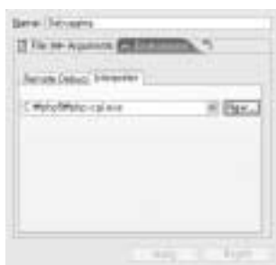
<화면 9> Debug 설정 창의 Environment 화면