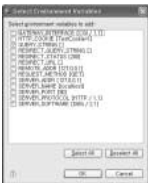
<화면 3> 환경 변수 선택 화면