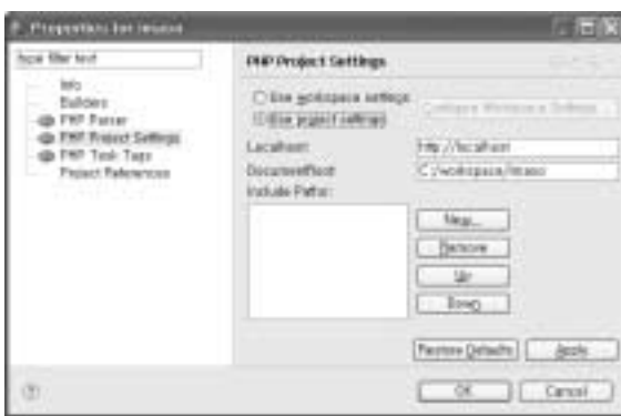
<화면 18> 프로젝트 workspace 설정 화면

이클립스로 돌아와 메뉴 'Window->Preferences' 창에서 'PHEclipse Web Development->Browser Preview Defaults'를 선택하여 두 개의 항목을 활성화한다. 만약 기본 workspace가 아닌 별도의 경로에서 작업하려 한다면 웹 서버의 Document Root를 해당 폴더 경로로 지정한다. 그리고 이클립스에서 Navigator 영역의 프로젝트 이름을 마우스 오른쪽 버튼으로 클릭하여 Properties 창을 열고 PHP Project Settings에서 'Use project settings'로 변경한다. Localhost에는 웹 서버의 URL을 입력하고 DocumentRoot에 원하는 작업 경로를 지정하면 된다. <화면 18>은 프로젝트에 대한 workspace와 웹 서버 URL을 변경하는 화면이다. 여기까지 완료하고 편집 화면으로 돌아가면 <화면 19>처럼 PHP Browser에 결과가 나타난다.