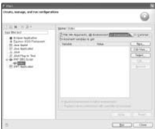
<화면 2> 환경 변수 지정 목록 화면

name=value&name=value와 같은 형식으로 원하는 값을 입력하면 웹 브라우저에서 입력받는 것처럼 $_GET 값을 얻을 수 있다(화면 4 참조). 이 외에도 원하는 임의 값을 지정할 수 있다. [항목 1]은 <화면 2>의 버튼에 대한 설명이다.